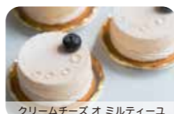
クリームチーズ オミルティエユ