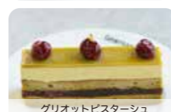
グリオットビスターシュ