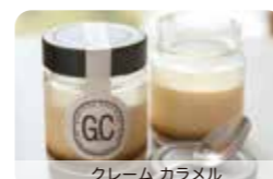
クリーム カラメル