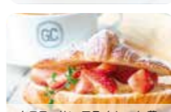
クロワッサン アラ クレーム 苺