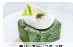
テリーヌショコラ 抹茶

ケーキ1個とお好みのドリンク1杯。 お飲み物はコーヒーまたは紅茶 のメニューからお選びください。 ¥ 1430