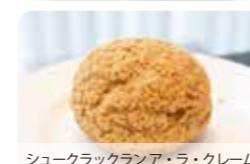
シュークラックランア・ラ・クレーム